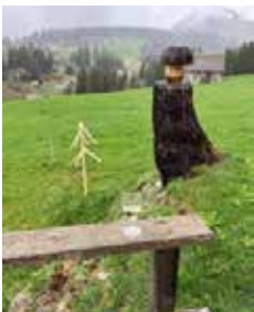
Der neue Baum „Immergrüne Douglasie“ sollte nach Abschluss der Kanalisationsarbeiten gesetzt werden.

Die Kanalisationsarbeiten rund um unsere Hütte wurden jetzt im August gestartet, der Anschluss erfolgt voraussichtlich Mitte September- Anfangs Oktober 2025.